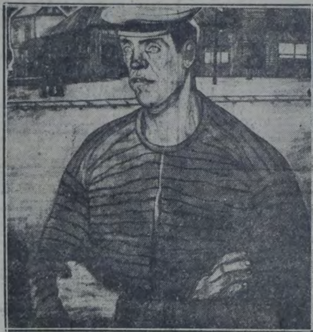
"MARINERO DEL DOCK SUD" (Oleo).—Enrique Policastro.

Empaño denso, ritmo de serenidad. "Doña Pancha", núm. 10. — Una evocación: Gauguin. No porque haya semejanzas sospechosas, sino porque el tipo de criolla opulenta, de piel aceitosa y ojos oblicuos, la alegría sonora de las flores rojas, el verde alto y luminoso de las hojas, el profundo de las persianas, y un sentido de unidad en todos los componentes, recuerdan las fiestas del sol en Tahiti entrevistadas en el "contre místicaireux de la pensée". Pero aquí co-