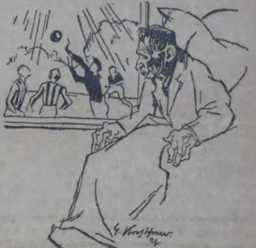
OCUPESE USTED EN SU JUVENTUD DEL DEPORTE. ESO LE PRESERVARA A USTED, EN SU VEJEZ, DE ENFERMEDADES Y ACHAQUES SENILES. HAGASE MIEMBRO DE LAS ASOCIACIONES SOCIALISTAS DEPORTIVAS.—(De la I. S. D.)

Los partidos Quilmes v. Boca Juniors, Gimnasia y Esgrima de La Plata v. Sp. Palermo y Sportivo Barracas v. San