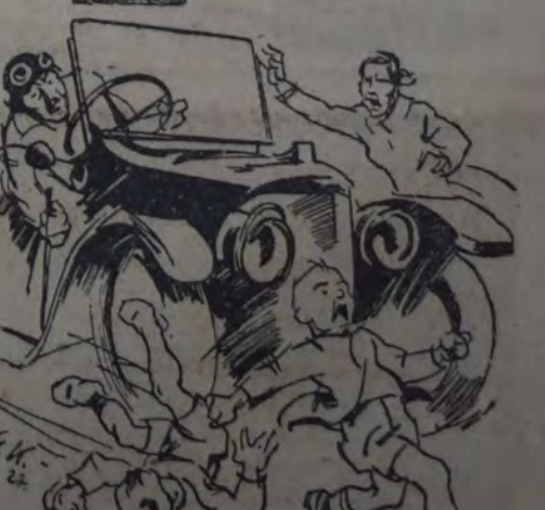
CUIDAD A VUESTROS HIJOS DE LOS PELIGROS DE LA CALLE. ENVIADLOS A LOS EJERCICIOS DE LAS ASOCIACIONES JUVENILES SOCIALISTAS. EN LA CASA DEL PUEBLO FUNCIONA UNA DE ESTAS INSTITUCIONES PARA NIROS.— (De la I. S. D.)