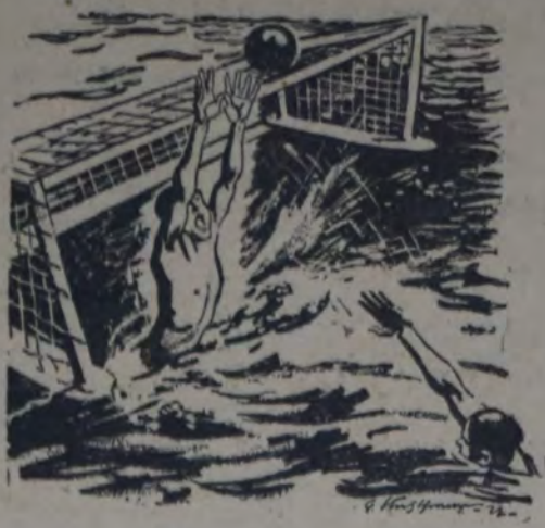
COMO EL GUARDAVALLE DEFIENDE SU ARCO, ASI DEFENDERAS TU SALUD Y EL INTERES DE TU CLASE SI TE HACES MIEMBRO DE LAS ASOCIACIONES DEPORTIVAS SOCIALISTAS.—(De la I. S. D.)

Tanto los referees, como los delegados y jugadores deberán acudir a la primera citación que se les haga por intermedio de LA VANGUARDIA. Se harán acreedores a la pena disciplinaria correspondiente los que faltaran.