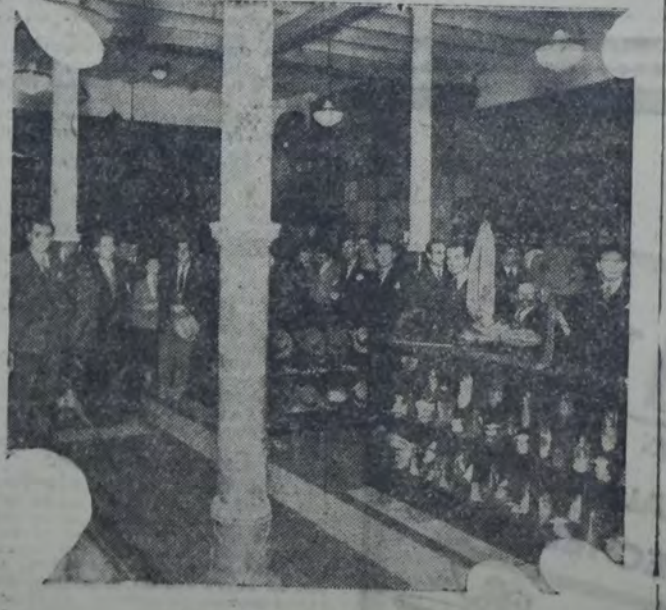
La sección ropería y sastrería