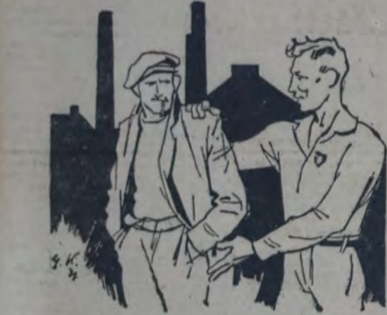
COMPAREROS! TE AFLIGES POR EL CANSANCIO. HAZTE ALEGRE EN LAS UNIONES DE LA ASOCIACION DE GIMNASIA Y DEPORTES OBREROS SOCIALISTAS.— (De la I. S. D.)

Referee, C. Da La Valle; delegado, Rotondo.