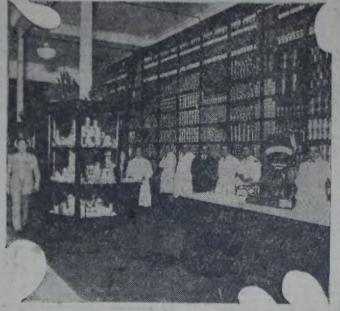
Vista de la sección comestibles de la proveeduría de la Mutualidad Postal inaugurada ayer

llevar a la práctica sus proyectos en tan corto lapso de tiempo. Hicieron la organización de seccionales que exigen el estado de una buena y disciplinada administración, la colaboración entusiasta de la mayoría del personal, el apoyo de la dirección general y el crédito alcanzado entre el comercio y las industrias del país. El personal de correos y telégrafos — nos agrada el citado — que tiene una marcada preferencia para agruparse en torno de las organizaciones que mejor atienden a sus necesidades de vida y trabajo, se sienta francamente