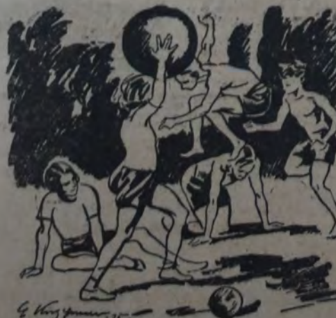
HACED JUGAR A VUESTROS HIJOS EN LAS INSTITUCIONES ADHERIDAS A LA INTERNACIONAL SOCIALISTA DEPORTIVA. EN LA CASA DEL PUEBLO FUNCIONA UNA DE ELLAS.